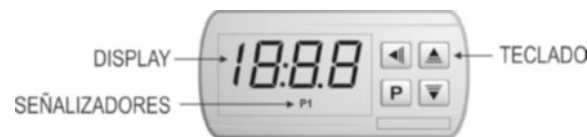
Fig. 01 - Panel frontal del controlador

En el panel frontal del controlador el selector P1 enciende cuando la salida de control es enchufada.